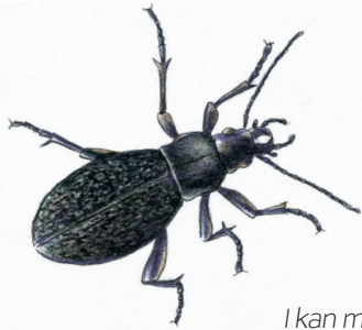
I kan møde løbebiller i haven, hvis I har en billebank.

En insektvold eller en billebank er et bed, som er lidt højere end resten af haven. Her kan rovbiller, græshopper og jagtedderkopper leve varmt, tørt og godt. I bedet kan I om foråret så en blanding af græsser og blomster. Om sommeren og efteråret lokkes en masse flyvende nyttedyr til insektvolden. Det er for eksempel bier, svirrefluer, snyltehvepse, mariehøns og gulddøjer. I mange økologiske landbrug bruger man insektvolde og billebanker som naturens egen skadedyrsbekæmpelse i stedet for at sprøjte markerne.