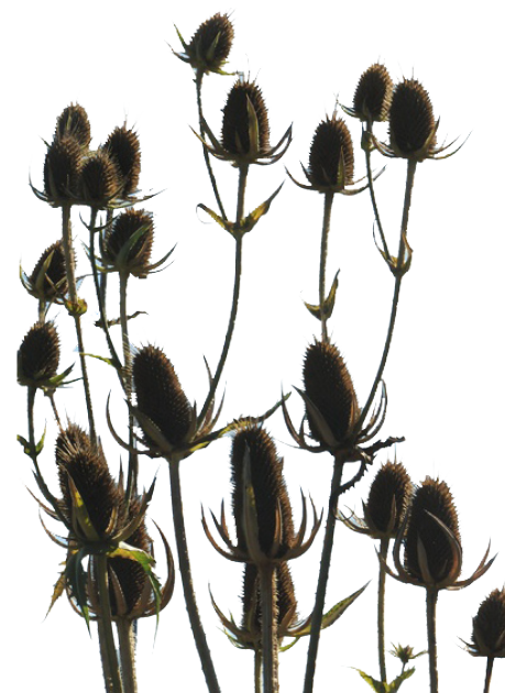
Gærde-kartebolle er flot i haven og meget populær hos sommerfuglene

og høj tidselkugle. Natsværmerne synes også om tobaksplanter, sæbeurt, lægekulsukker, pil og almindelig gedebled.