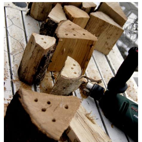
Insekternes egen boligblok kan give læ og ly til insekterne langt ud i fremtiden

Med nogle gamle brædder, pletter, brændestykker, hullede mursten, naturmaterialer og haveaffald, kan du bygge et smukt og brugervenligt insekthotel for insekter og andre smådyr. Design, størrelse og materialer tilpasser du selv. Det vigtige er, at hotellet er fyldt med små huller og huler, hvor insekterne enten kan ligge beskyttet og tørt gennem vinteren eller lave reder henover foråret og sommeren. På billederne er boligblokken blandt andet fyldt med siv, hullet træ, muslingskaller, kogler, mos, gamle urtepotter og afsavede grene.