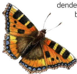
Nældens takvinge er en almindelig sommerfugl i haven

der, krybdyr og pattedyr. Hvis I vil have en naturlig have med masser af liv, er det derfor en god ide at tage sig lidt af de små. Indretningen af vilde levesteder giver jer de bedste muligheder for at komme tæt på de mange spændende insekter. Alle dyr har brug for mad, vand og gemmesteder,