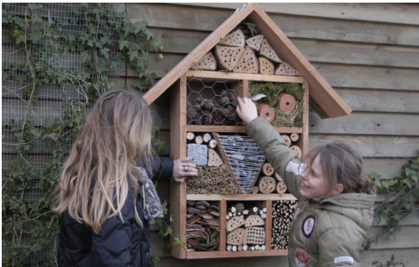
Insekternes egen boligblok kan bruges som ly, læ og reder for et hav af små dyr i haven

Din have er også natur, og alle haver kan med en lille indsats forvandles til små grønne oaser for liv, der tager ophold eller er på gennemrejse.